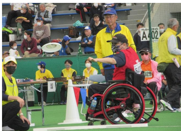
アキュラシーとディスタンスが行われました。