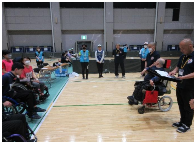
表彰式も各コートで