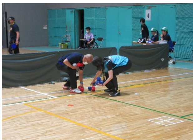
主審に協力し、ボール回収