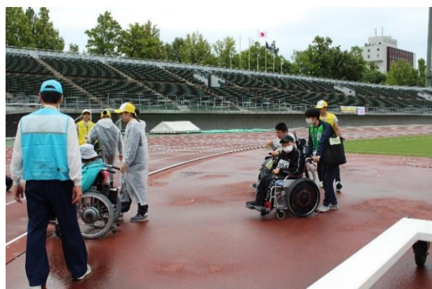
ビーンバック投ピットへ移動 選手・介助者・誘導ボランティアとともに