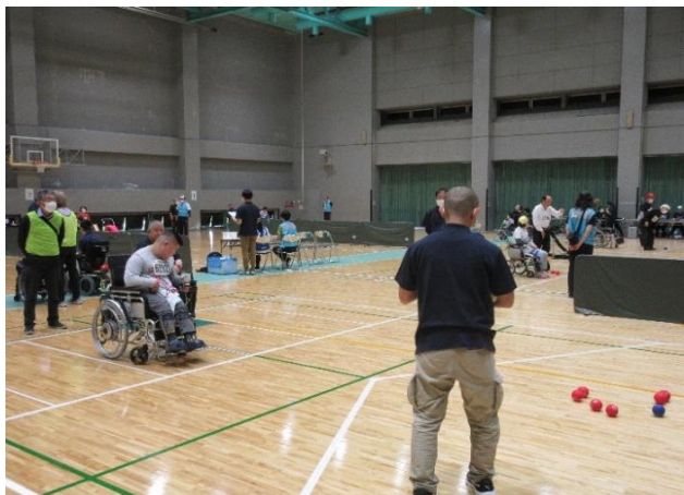
ボッチャはコート6面を使用 機中使用するいすへの介助等