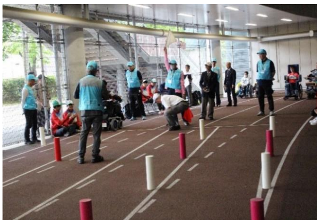
スラローム 雨天のため屋内練習場で実施