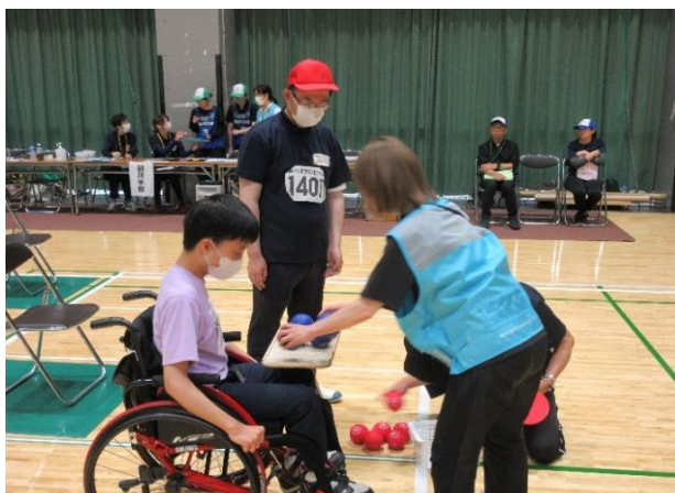
各コートでボールを取りやすいようセットや線審、待 機中使用するいすへの介助等