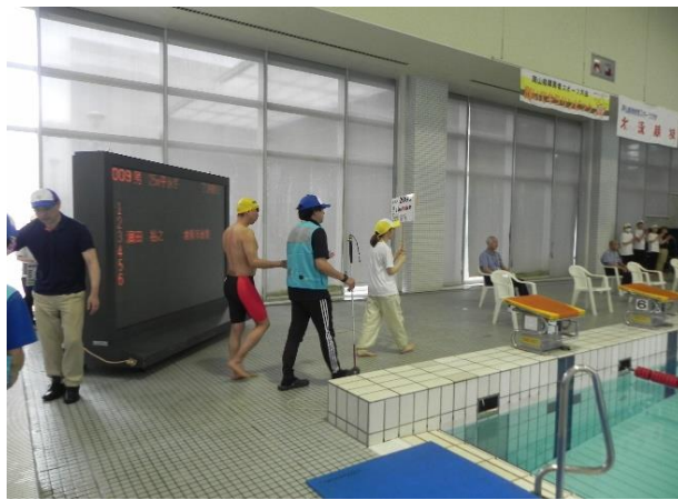
視覚障害選手（23区分）の誘導