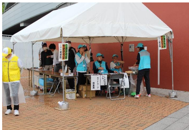
介助許可証・伴走者許可証配布、当日介助申請書受付