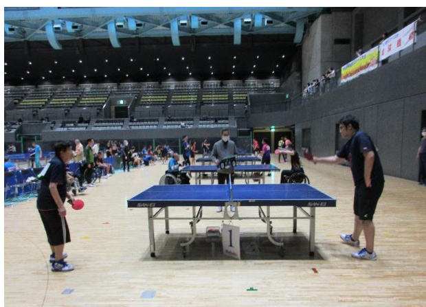
障害が肢体障害、視覚障害、聴覚障害、知的障害、精神障害と別室でサウンドテーブルテニスも行っています