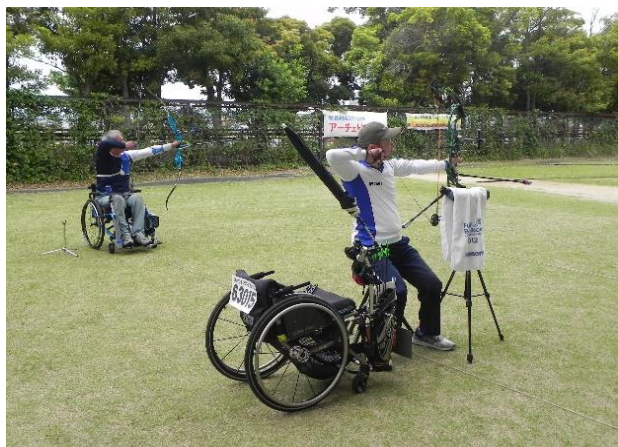
リカーブ コンパウンド