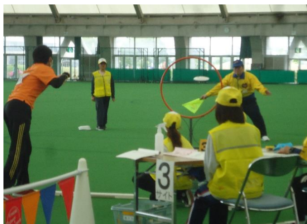
誘導、記録など協力