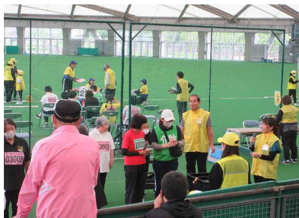
アナウンス、誘導を協力